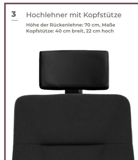
3 Hochlehner mit Kopfstütze Höhe der Rückenlehne: 70 cm, Maße Kopfstütze: 40 cm breit, 22 cm hoch