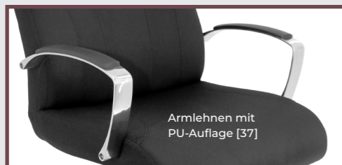
Armlehnen mit PU-Auflage [37]