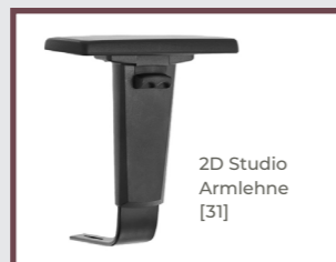
2D Studio Armlehne [31]