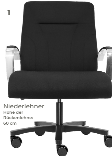
1 Niederlehner Höhe der Rückenlehne: 60 cm