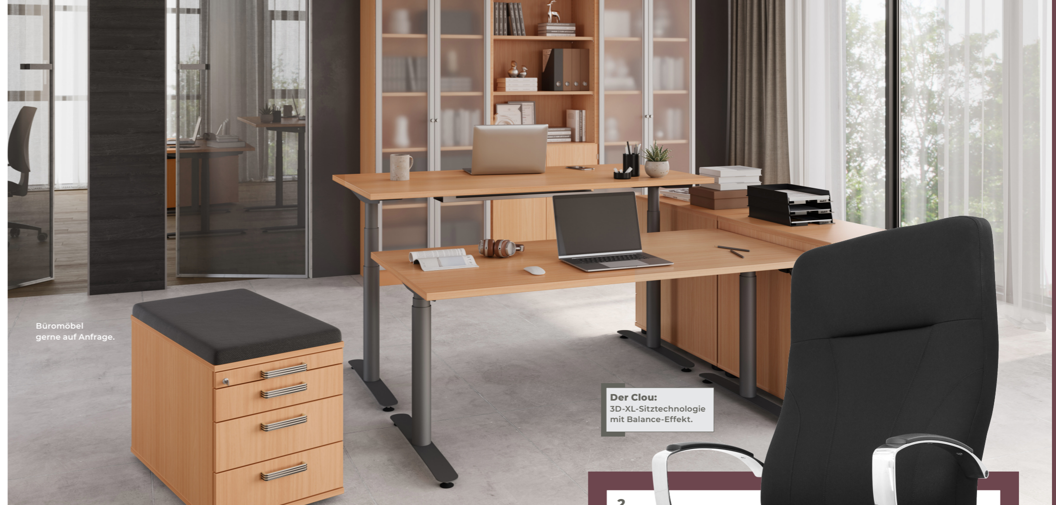
Büromöbel gerne auf Anfrage.